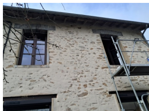
Changement des 2 fenêtres au dessus de la BCD côté