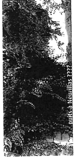
Puits à Neuwillas ????